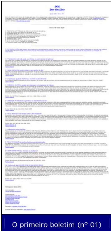
O primeiro boletim (nº 01)

O primeiro boletim DOL – Dor On Line foi lançado em agosto de 2000, em meio a um grande conjunto de acertos... e, obviamente, outro grande conjunto de erros... Principalmente operacionais, devido à nossa inexperiência. Entretanto, ainda assim, a “criança” nasceu! E isto valeu um acalorado almoço de comemoração em um dos restaurantes do CAMPUS da USP. Conseguimos!