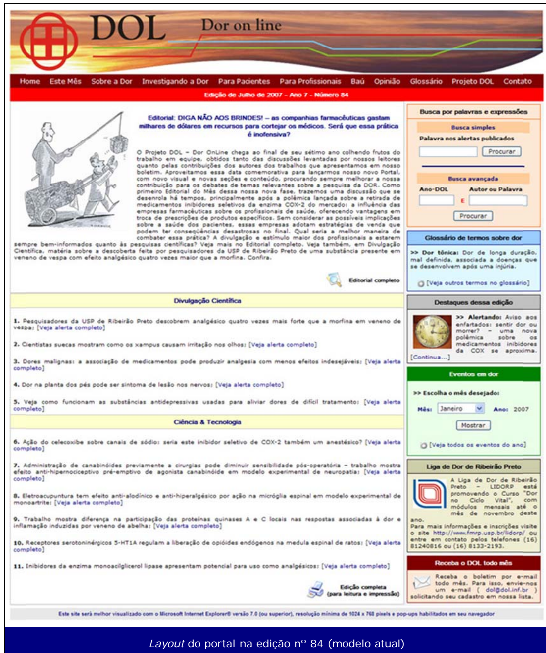
Layout do portal na edição nº 84 (modelo atual)