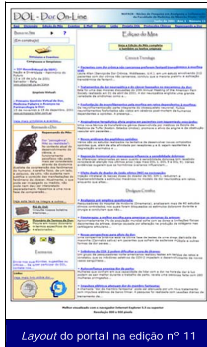
Layout do portal na edição nº 11

Tecnicamente o projeto ainda precisava melhorar muito e,